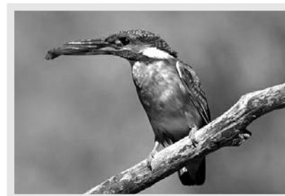
Nádherně zbarvený Ledňáček říční bývá skutečně k vidění i u rybníku Vavřinec.

Pro ornitologický výlet k rybníku Vavřinec samozřejmě organizátoři doporučují dobré obutí i oblečení a případně také dalekohled. Zážitky z pozorování ptáků mohou být díky němu mnohem silnější.