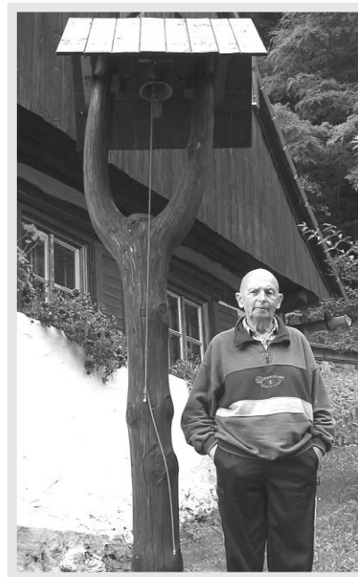
Právě z této zvonice oznamuje řezbář každý večer celému okolí čas klekání.

ších lidí a že by Občanské sdružení pro rozvoj Kácovska i místní radnice chtěly časem vybudovat naučnou stezku, jejíž součástí by byl i Václaviček.