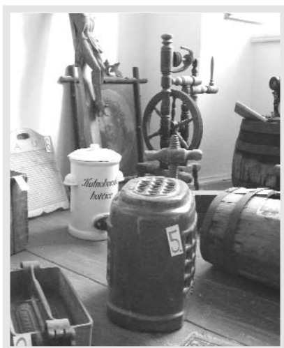
Nová expozice o historii Kácovska připomíná časy již dávno minulé.

se návštěvnickým magnetem. Celé rodiny se zde bavily kvízem, v němž mají návštěvníci uhodnout, k čemu původně sloužily některé z vystavených předmětů. Třebaže pamětníci byli ve výhodě, protože třeba valchu dávno nahradily automatické pračky, zcela vyhráno neměli. Například sušičku fotografií, která patří k největším exponátům výstavy, by ve zvláštní dvoumetrové skříni opravdu nikdo nehledal.