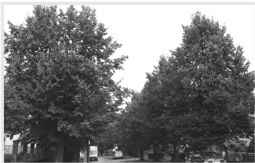
Lipová alej v Nádražní ulici vypadá zdaleka zdravě, skutečnost je však, bohužel, jiná.

stromy sledovali již od podzimu loňského roku a zvláštní pozornost jim pak věnovali od jara a ve vegetačním období, se shodují, že kácovské lípy byly nevratně poškozeny neodborným, či spíše likvidačním, řezem v roce 1996. Oba dendrologové z Agentury ochrany přírody a krajiny ČR mají za to, že až na několik málo exemplářů nejsou zdejší stromy do budoucna perspektivní.