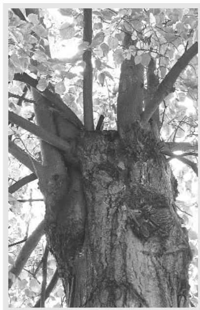
Neodborný řez korun odsoudil již před čtrnácti lety většinu stromů k záhubě.