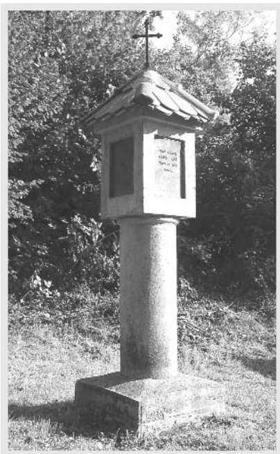
Na první pohled je vidět, že o kapličku i její okolí je pečováno s opravdovou láskou.

Osvědčil se však jako dobrý strážce i řezbář. Díky němu dnes zdobí kácovskou radnici krásná socha českého patrona, jemuž velmi nenápadně pomáhá i další světec, sv. Bartoloměj. Když bylo potřeba sehnat měděný plech pro stříšku nad plastikou, vypomohl řezbář pan farář z kolínského chrámu zasvěce-