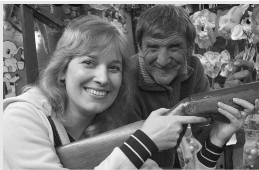
Když na to přijde, růži z pouti si ve střelnici kácovské slečny taky dovedou vystřelit.

Živo bylo nejen na náměstí, kde na malé i velké návštěvníky čekala řada pouťových atrakcí a dobrot, ale také kolem kostela, zámku, nádraží, pivovaru a řeky Sázavy. A samozřejmě taky téměř ve všech kácovských domácnostech, protože tradice rodinných setkávání a návštěv v čase naší pouti zůstává stále živá. Díky místním nadšencům a členům sdružení Anno Domine Martinice, kteří stihli ve velmi krátkém čase připravit v prostorách zámku novou expozici věnovanou historii Kácova i celého regionu, nepůsobil náš zámek až tak smutně. Naopak, stal