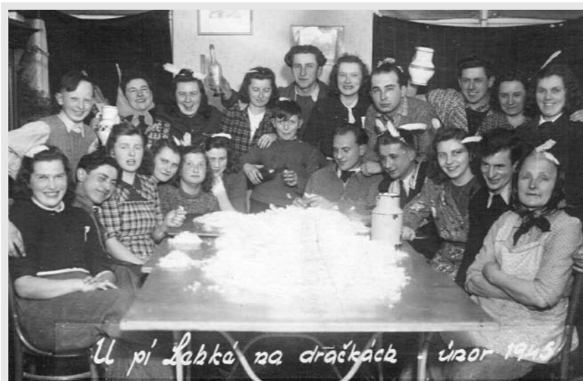
Sousedská posezení bývala na denním pořádku. Když k tomu nebyla zrovna taková příležitost jako draní peří, našla se bez potíží jiná.

Také o historii většiny místních spolků může hovořit se znalostí věci. Pamatuje všeobecné nadšení, které provázelo akce někdejšího Okrašlovacího spolku, jenž vybudoval například plovárnu Na skalce, tenisové kurty i promenádu k Václavičku. Za fotbalovým míčem se honil spolu s dalšími hráči AFK Kácov. Cvičil v Sokole, léta hrál divadlo s kácovskými ochotníky, kterým umožnili za války vystupovat místní hasiči, když divadelní činnost takzvaně „zaštili“. Mezi hasiče stále rád zajde nejen na výroční schůzi. Nyní k tomu má o důvod víc. Bude pro ně pravidelně připravovat jakési „hasičské historické okénko“. Střípky ze života kácovských dobrovolných hasičů, které z historických pramenů připravil na letošní výroční schůzi, se totiž všem moc líbily.