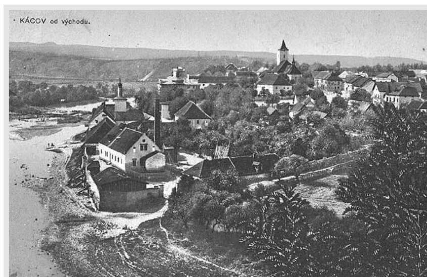
Kácov bez mostu. Do té doby se vše, i úroda z císařských polí nad Račiněvsí, přepravovalo přes vodu. Ze břehu na břeh se tu stěhovaly i celé koňské povozy.

Podobně dokáže představit i historii dalších míst. A vše má také osobně prochozeno a prozkoumáno. „Vždycky jsem chtěl všechno vidět na vlastní oči a jak se říká, na historii si sáhnout. Také se dodnes rád potkávám s lidmi, kteří mohou o tom,