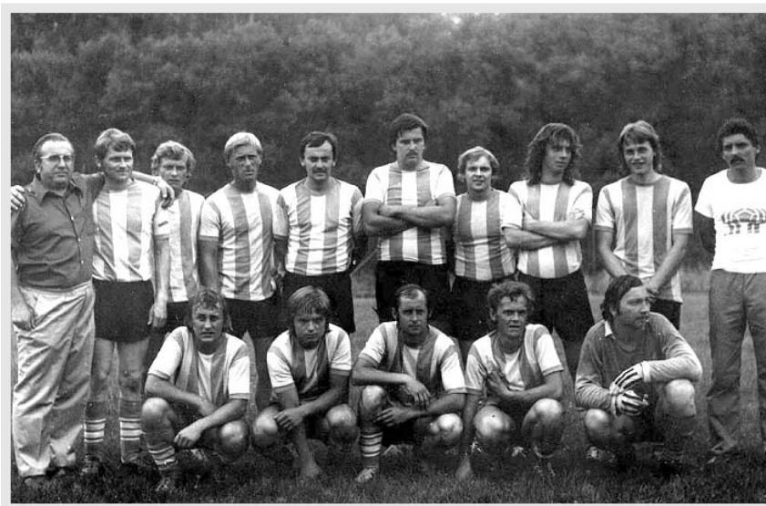
Fotbal nemohl v Kácově chybět. O zdejší trávník se ve 30. letech minulého století dělily hned dva kluby - SK Kácov a ŽOS. Ty pak společně daly dohromady zmiňovaný AFK Kácov.