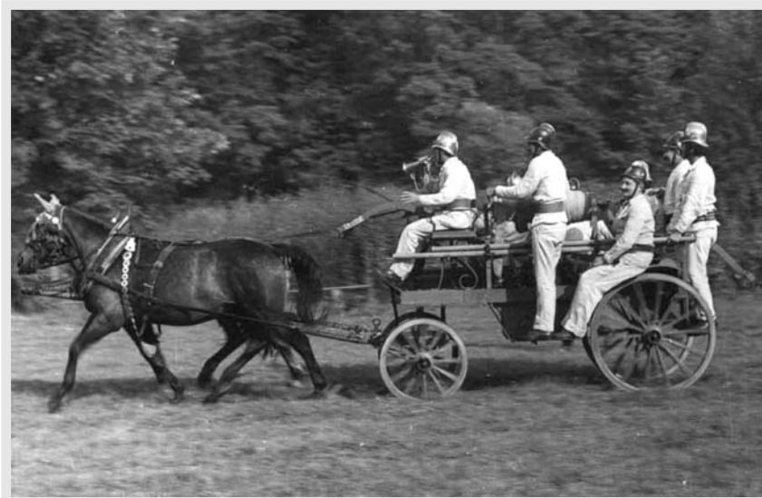
100. výročí oslavil v roce 1975 kácovský Sbor dobrovolných hasičů opravdu velkolepě. Kvalita dochovaných fotografií však není valná. O to víc se hasiči podobají svým předchůdcům.