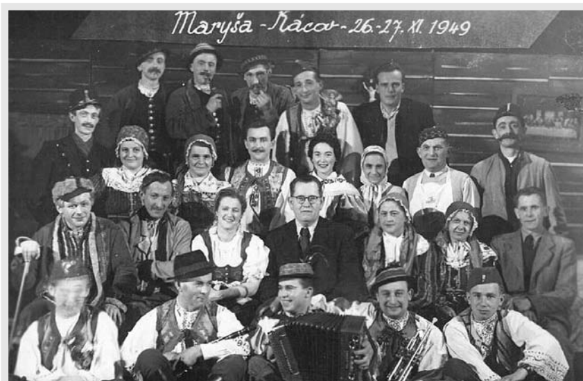
Každá premiéra kácovských ochotníků byla vždy velkou událostí. Soubor pravidelně zajížděl i do mnoha míst v Posázaví a všude byl samozřejmě vítán.