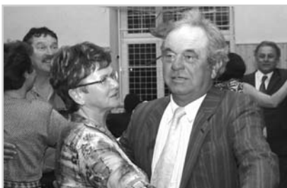
Na rybářském plese se tančilo až do rána