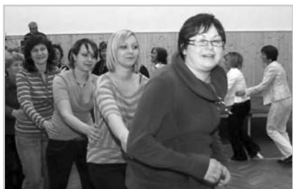
MDŽ i Den matek si kácovské ženy užily