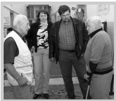
Na chodbě zámku se nehovořilo jen o historii. Na pořadu dne bylo i aktuální dění.