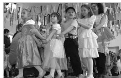
Dětský karneval byl díky SDH se vši parádou