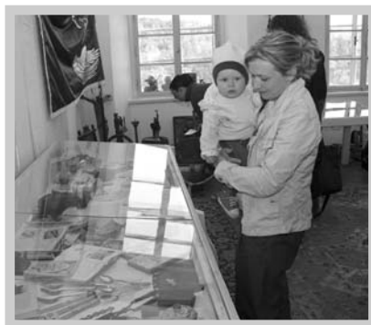
Bohatou historii městyse i regionu připomínají v muzejní expozici také desítky dokumentů.