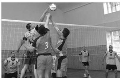
Okresní pohár ve volejbale mužů