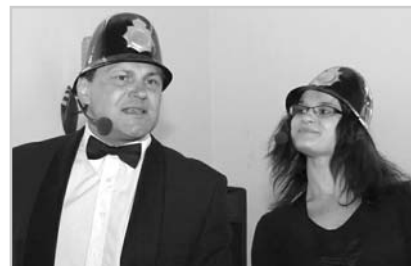
Slavnostní otevření zámeckého muzea