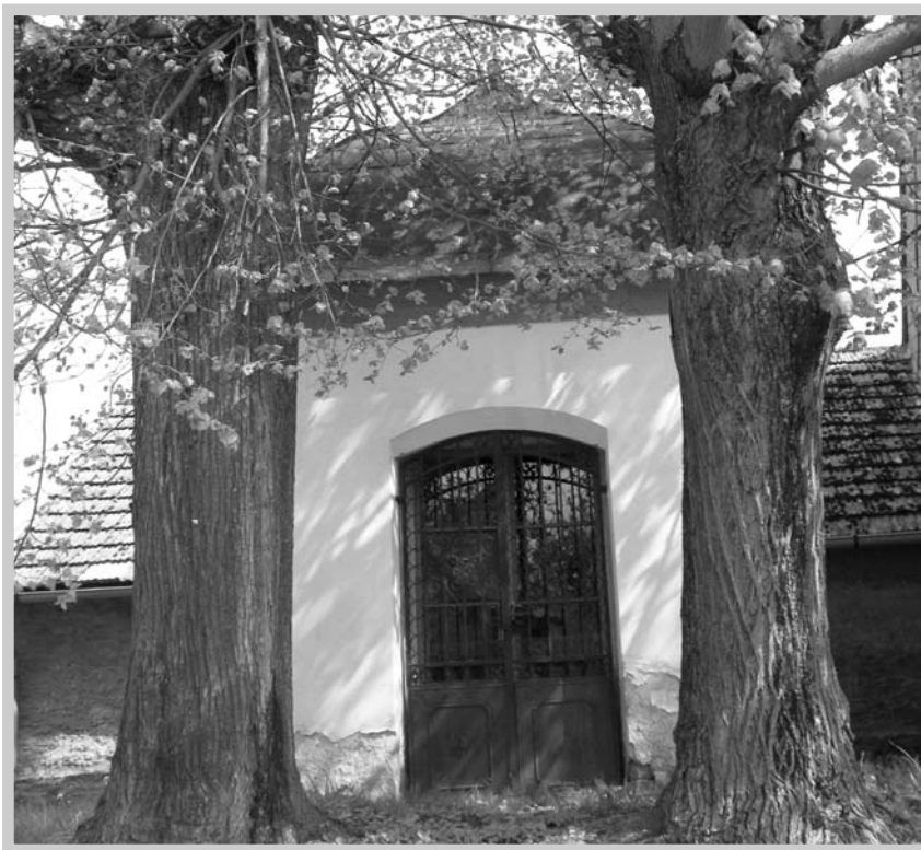
Barokní kapličku lze snadno přehlédnout. Stojí v těsném sousedství domů a její bání zakrývají mohutné koruny dvou lip.

Zřejmě později byla kaplička zasvěcena úctě k Nejsvětějšímu Srdci Ježíše. Tento kult se rozšířil v katolické církvi na základě opakovaných zjevení svaté Markéty Marie Alacoque v klášteře v Paray-le-Moni-