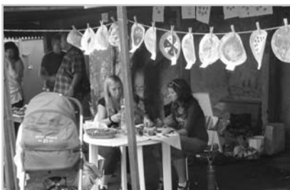
Posvícenský jarmark byl akcí pro celou rodinu.