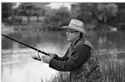
Noční rybářské závody si užilo 125 rybářů.