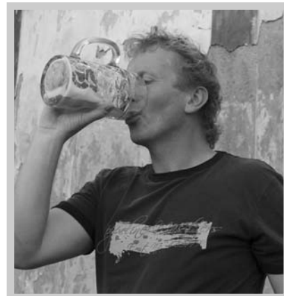
Soutěžní tuplák na ex? V Kácově klidně!