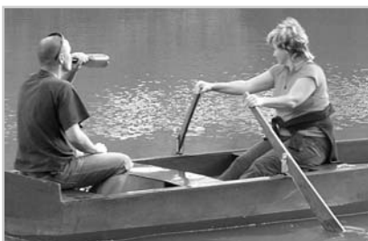
I takto vypadala letní pohoda na Sázavě.