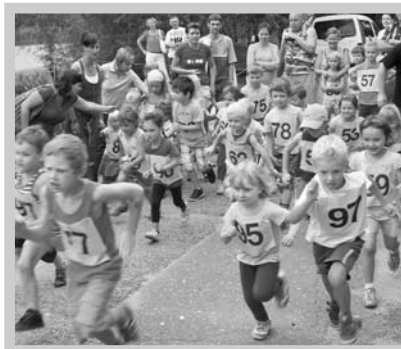
O běžecké naději je v Kácově postaráno.