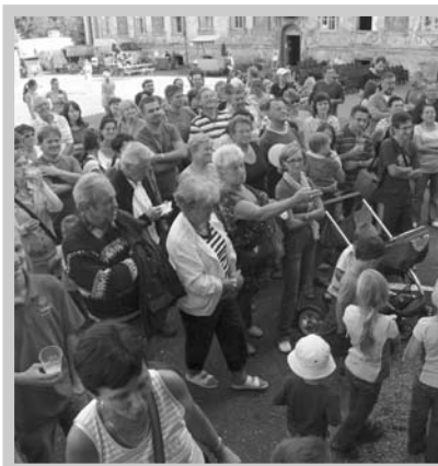
Zámecké nádvoří plné lidí a pohody.