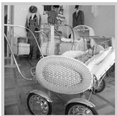
Právě tímto kočárkem to všechno začalo.