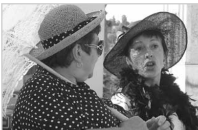
Veteran Rallye Posázaví, krásný návrat v čase.