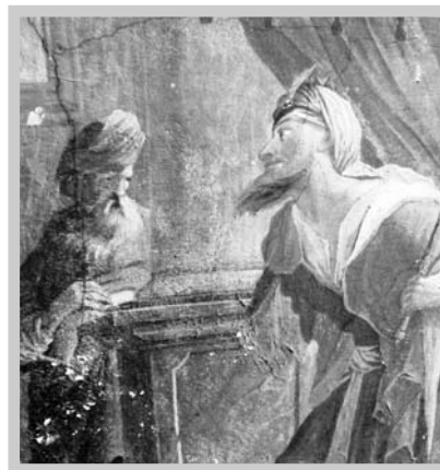
Detail vzácné fresky v zámecké kapli.