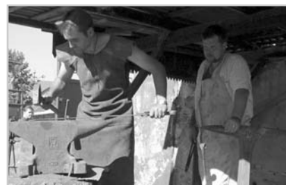
Díky naší pouti ožila i zapomenutá řemesla.