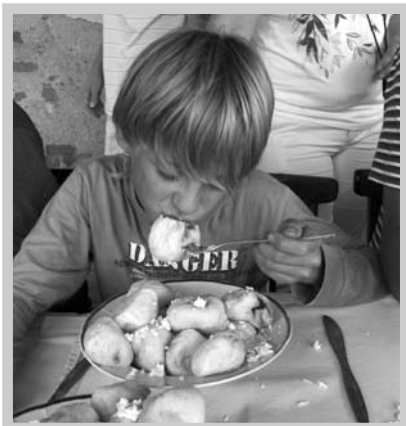
S knedlíky se statečně popraly i děti.