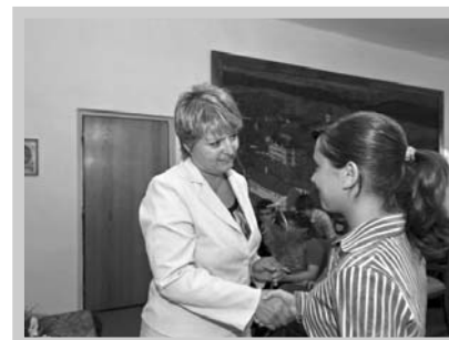
Absolventům popřála štěstí i naše starostka.

Filmovou písničku Sladké mámení pak krásně zazpívaly moderátorky programu.