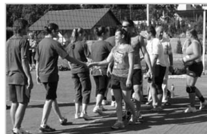
Splašený Kácov, turnaj sportu i přátelství.