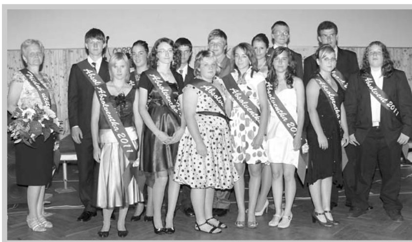
Fotografie bude dnes už bývalým devátákům připomínat kácovskou školu a kamarády.

V pátek 17. června se od 17 hodin uskutečnila další Letní školní akademie. Celý odpolední program byl tentokrát věnován