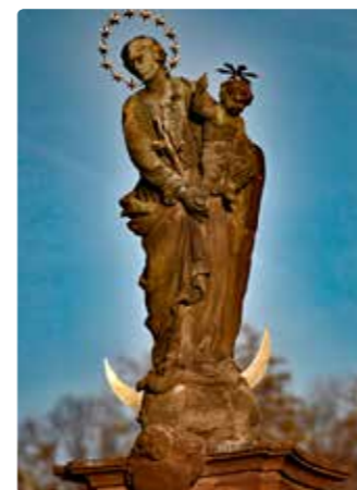
Panna Marie s Ježíškem