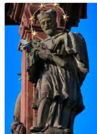
Svatý Jan Nepomucky