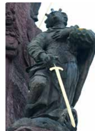
Svatá Kateřina Alexandrijská